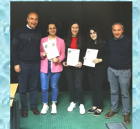
Olimpiadi di matematica, scienze, fisica e italiano