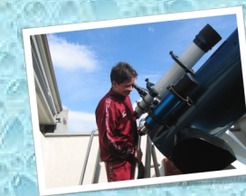
Laboratorio di astronomia