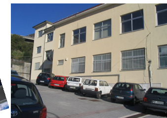
Ingresso sede centrale