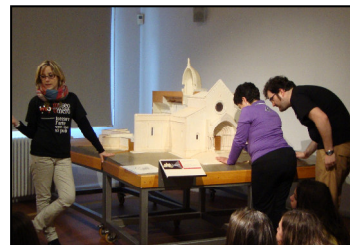
Museo tattile 'Omero'