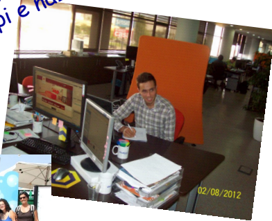
Work-experience Faro, Portogallo

L'educazione un mezzo straordinario per produrre lo sviluppo personale e per costruire rapporti tra individui, gruppi e nazioni.