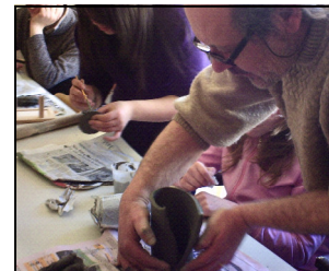
Laboratorio di ceramica