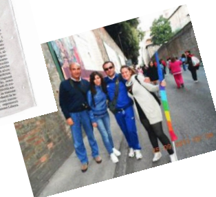
Marcia della Pace, Perugia-Assisi